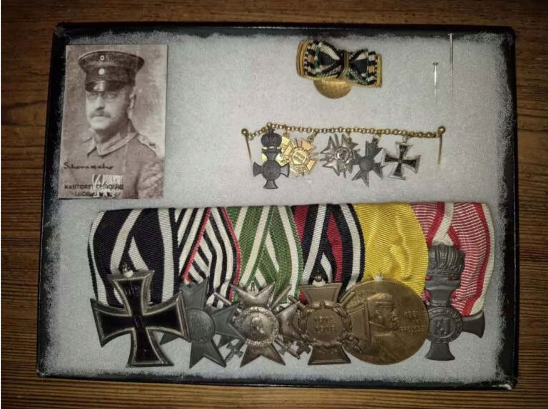
Das auf dem Tisch befindliche Konvolut im Detail