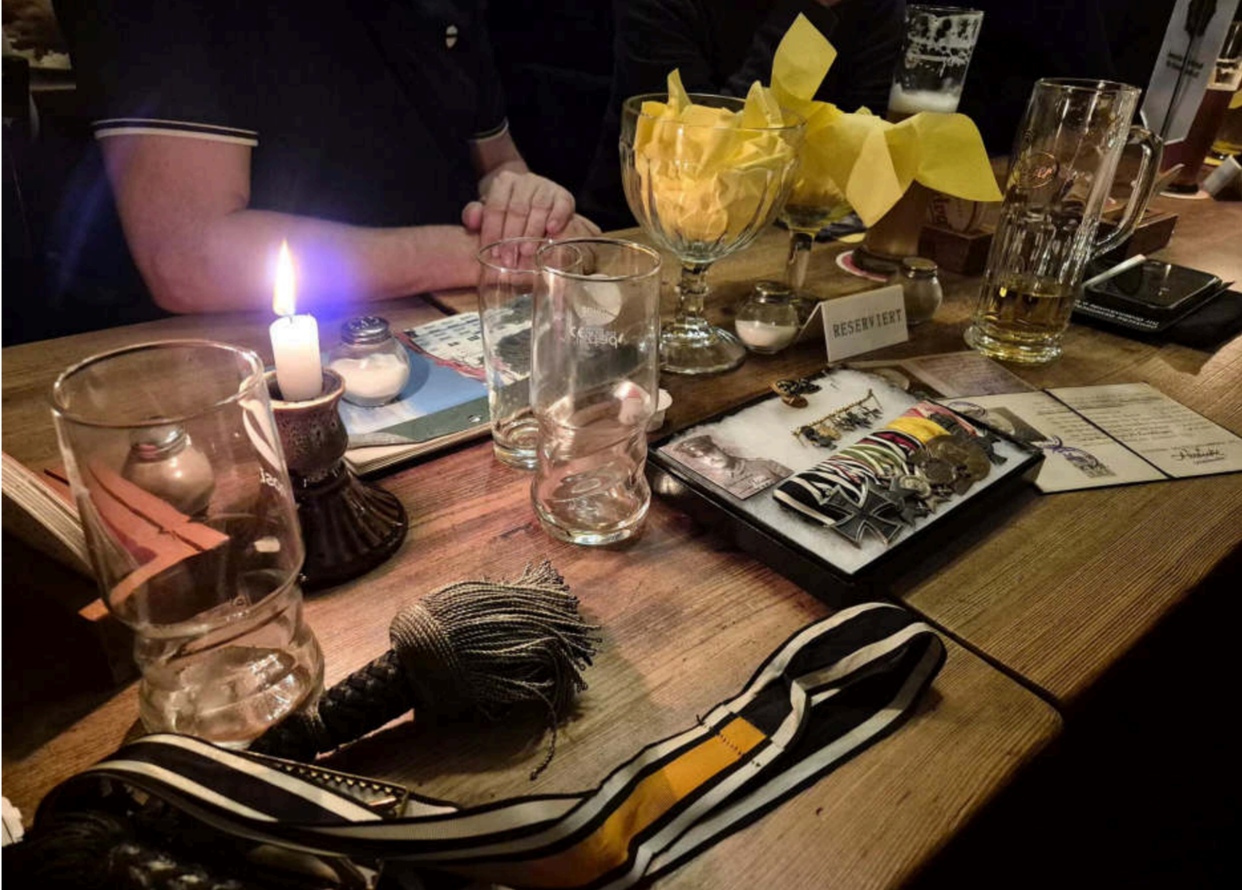
Sammlungsstücke zwischen Tischkerze und Trinkgläsern

Bei diesem Treffen wurden von den Mitgliedern der DGO viele originale Sammlungsstücke mitgebracht und allen gezeigt. Wir erhielten zu den einzelnen Stücken ergänzende Details mitgeteilt und erfreuten uns an dieser besonderen Art eines Zusammentreffens von Fachleuten.